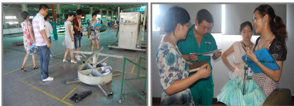
节能大使现场巡查

2010 年度公司积极推行节能减排活动,成立能源计量管理小组,降低单位能耗,提倡不开空调和白天减少照明,并推选出 30 多位“节能大使”,对车间和厂区进行巡查。使公司全体员工养成节约资源、爱护环境的习惯。本次活动管理层以身作则,带动广大员工也从自身做起,从小事做起,节约每一度电,每滴水,每张纸,为保护环境、保护地球而献上自己的一份薄力。